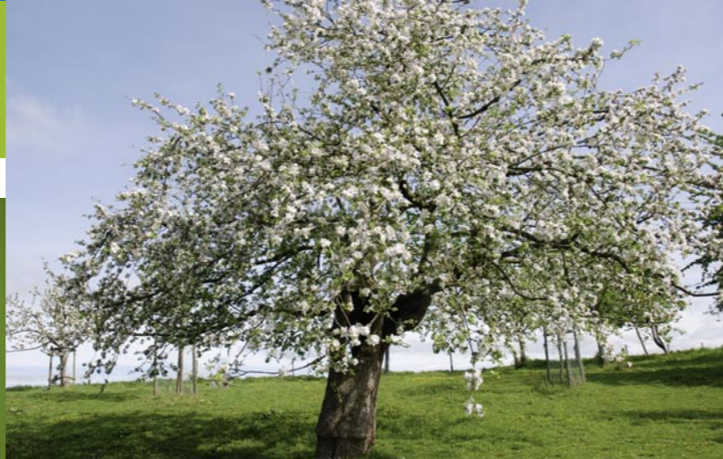
Frühling: blühender Apfelbaum