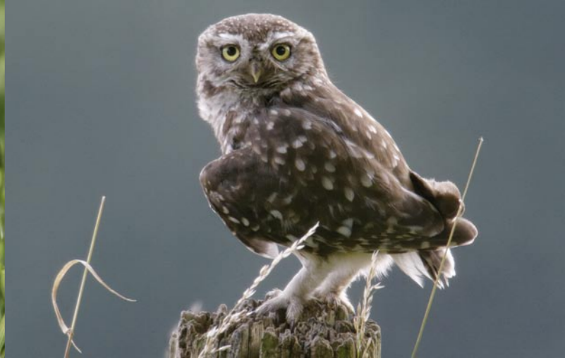
Herbst: Steinkauz und Winter: Obstwiese im Schnee