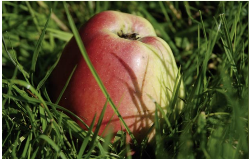
Apfel, Birnen, Mirabelle, Kirsche, Apfelkorb

Auf allen vier Routen werden geführte Wanderungen angeboten. Die Termine für die öffentlichen Führungen können bei der NABU-Naturschutzstation Leverkusen - Köln bzw. Biologischen Station Mittlere Wupper erfragt werden. Individuelle Exkursionen für Gruppen oder Einzelpersonen sind auf Anfrage möglich – Rufen Sie uns an!